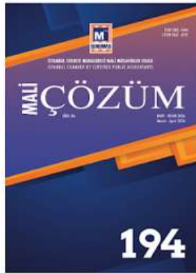
↓ MALİ ÇÖZÜM DERGİSİ (Sayı 194) MART-NİSAN 2026