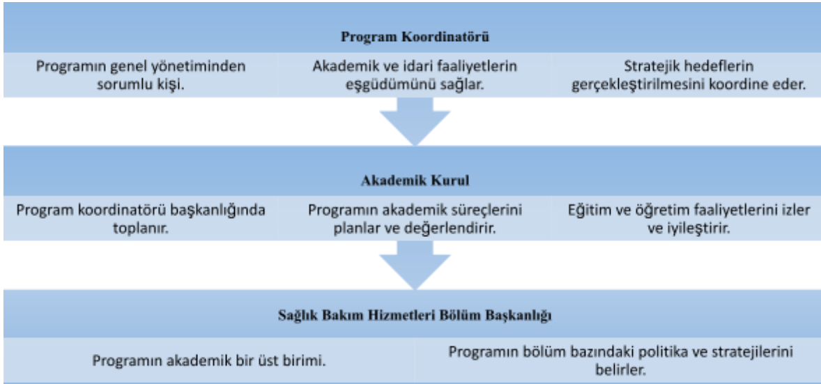
Şekil 1. Sağlık Bakım Hizmetleri Bölümü Yönetişim Modeli ve Organizasyon Şeması