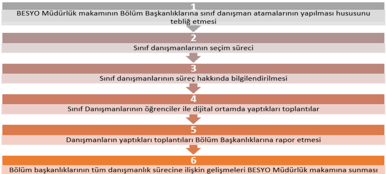
Şekil 1: Sınıf Danışmanlarının Seçimi ve Süreç Raporlaması İş Akışı