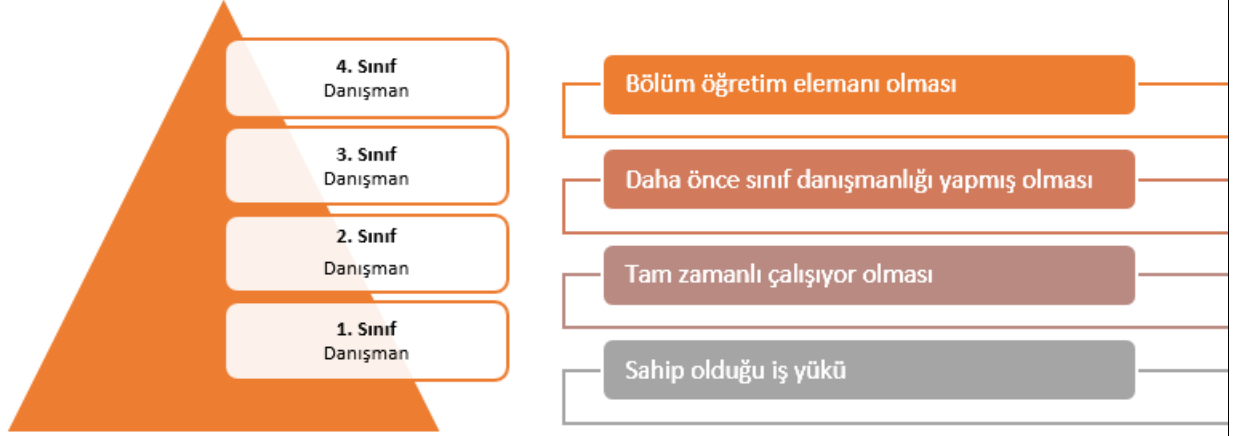
Şekil 2: Sınıf Danışmanı Öğretim Elemanı Seçimi Kriterleri