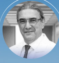
Prof. Dr. Kemal Türker Diş Hekimliği Fakültesi