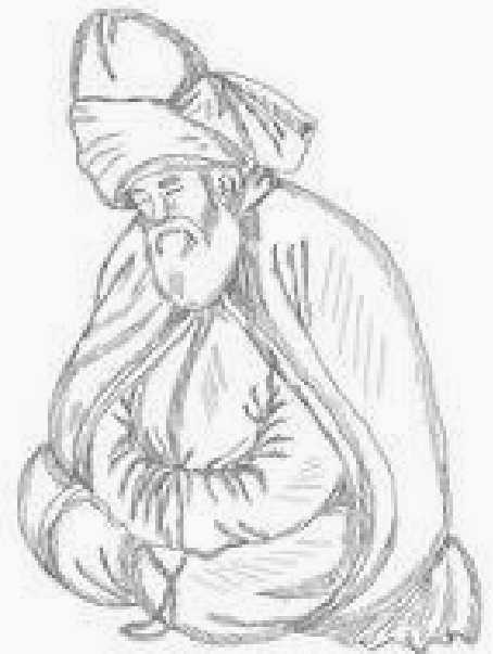
Mevlana Celaleddin Rumi

"Ben yaşadıkça Kur'an'ın bendesiyim, Ben Muhammed-i Muhtarın'ın ayağının tozuyum, Eğer biri benden bundan başka bir şey naklederse, Ondan da şikâyetçiyim, o sözden de şikâyetçiyim."