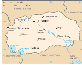
(Resim:2 Üsküp'ün Haritası)

Şairin bahsettiği Rakofça eski Sırbistan sınırının bilinen bir noktası olan Zıbıfça'nın üstünde bir köydür. Buraya Üsküp'ten her yaz ayında on beş yaşına kadar gider gelir. Üsküp ise, Osmanlılar devrinde Kosova (Kosovo) vilayetinin baş şehri olmuştur. Bugün Yugoslavya Sosyalist Federatif Devleti Makedonya Cumhuriyeti'nin başkentliğini yapmaktadır. Üsküp aynı zamanda iktisadi, siyasi ve kültürel hayatta önemli bir ulaşım merkezidir. Üsküp adı bir İilir kabilesinin yerleştiği Skupi'den gelmekte olup tarihi kaydedilemeyecek kadar eski bir yerleşim yeridir. Arapça'da suların akması ya da kaynaması anlamına gelen Üsküp, özellikle 1389 senesinde Kosova Meydan Muharebesiyle büyük bir önem taşır. Yıldırım Beyazıt'ın ilk hükümdarlık senelerinde Üsküp Türk hakimiyetine girer.