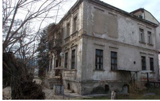
(Resim: 7 Yahya Kemal’in çocukluğunun geçtiği Kumbarcılar Konağı)