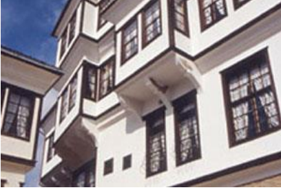
(Resim: 3 Üsküp'te Türk mimarisi)

12 hamam, 20 türbe, 1 saat kulesi, 2 çeşme ve binlerce Türk mimari tarzıyla evler yapılır. Yahya Kemal boşuna “yalnız bizimdi, çehre ve ruhiyle bizimdi o” dememiştir.