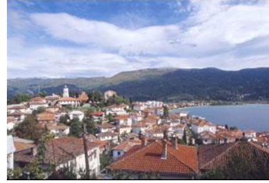
(Resim: 4 Üsküp'ten bir manzara)

Yahya Kemal, hatıralarında doğduğu yer ve doğumuyla ilgili olarak şunları söyler: “1884 Kânunievvel'inin (Aralık) 2'sinde Üsküp'te, İshakkıyye Mahallesi'nde, büyük validem Adile Hanımın konağında, bu evin cepheye doğru sağ taraflarındaki arka odada, sabaha karşı doğmuşum. Salı günü imiş. Üsküp'e o gün nadir görülür bir kar yağmış. 1886'da kardeşim Reşad'ın aynı evde doğmuş olduğunu pek hayâl meyâl olarak hatırlıyorum. Annemin loğusa yatağı, evin cepheye doğru sonundaki ön odada idi. (3)