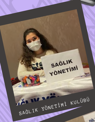
SAĞLIK YÖNETİMİ KULÜBÜ