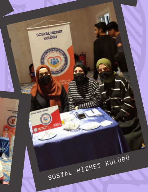
SOSYAL HİZMET KULÜBÜ