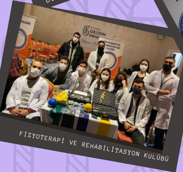
FİZYOTERAPİ VE REHABİLİTASYON KULÜBÜ