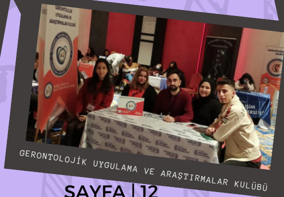
GERONTOLOJİK UYGULAMA VE ARAŞTIRMALAR KULÜBÜ