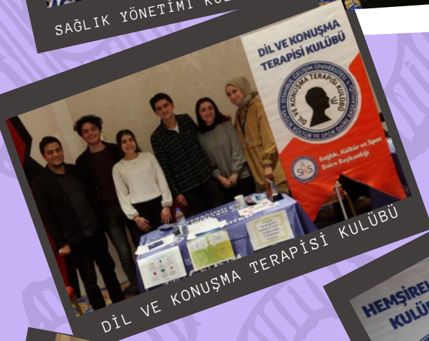
DİL VE KONUŞMA TERAPİSİ KULÜBÜ